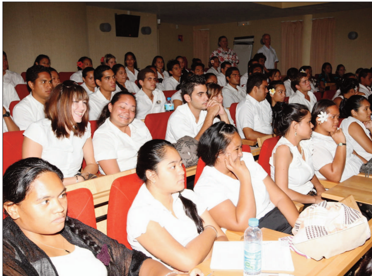
À l'auditorium, des étudiants des cinq classes de BTS, soit environ 140 élèves.

■ La nouveauté est la mise en place d'un prix pour le meilleur élève en BTS hôtellerie et la première promotion ne sera connue que l'année prochaine.